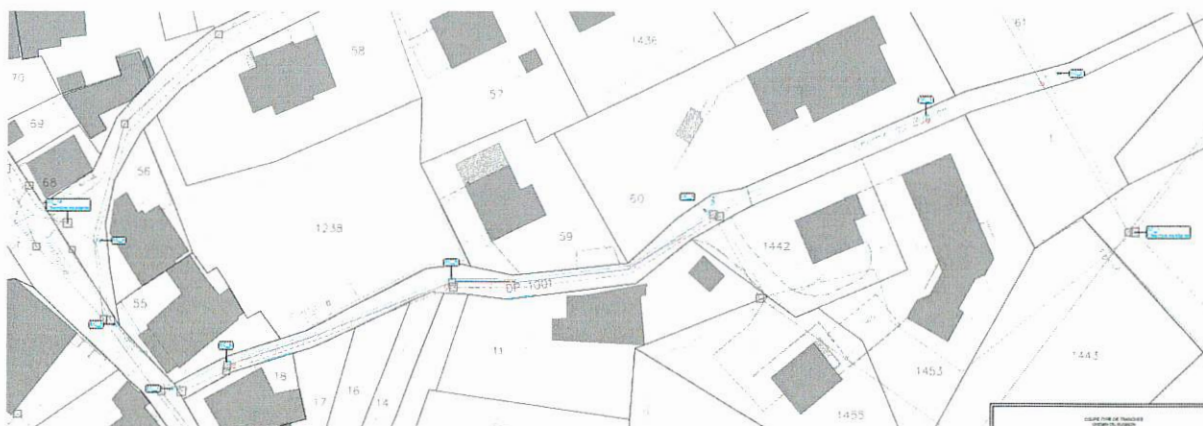
Plan des travaux