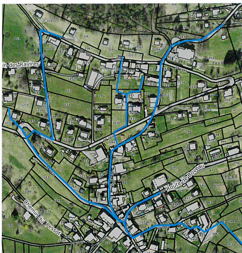
Schéma simplifié du réseau EC se déversant au chemin du Bugnon.

A la demande des pompiers, une borne hydrante sera installée au bout du Chemin du Bugnon.