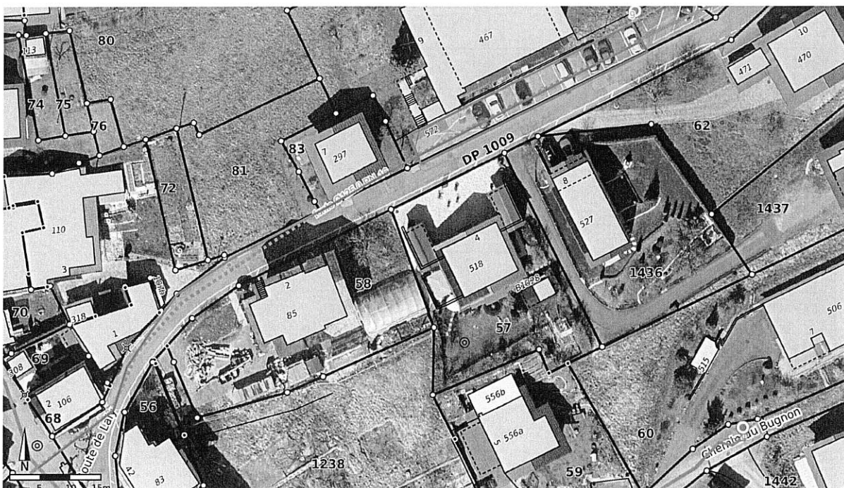
Plan de situation des travaux.

Lors de la fuite du 28 août 2023, beaucoup de matériaux ont été emportés par les eaux. Une importante cavité s'est formée sous les places de parc devant le bâtiment des Dents du Midi. Une réparation d'urgence a été réalisée. Mais vu l'importance des dégâts, il est nécessaire de refaire complètement ces places.