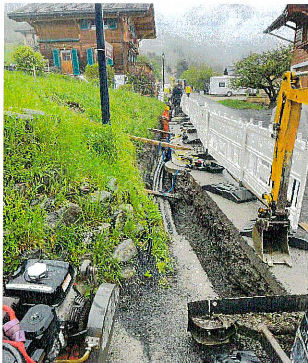
Tranchée à la Route de Boveau

La conduite depuis l'extrémité Est du parking du bâtiment des Dents du Midi allant jusqu'à la fontaine au centre du village a été remplacée, ainsi que toutes les vannes de ce tronçon (voir PM-24-03).