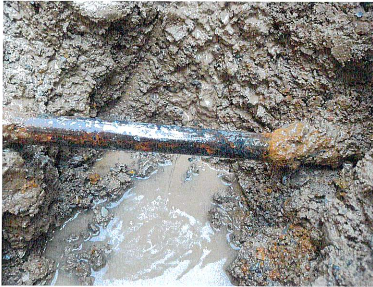
Fuite d'eau potable

Le mercredi 21 février 2024, deux fuites ont été réparées au Chemin des Ravires.